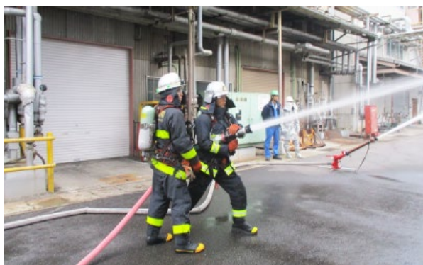
公設消防隊との合同訓練 (四日市事業所)

す。防災訓練においては、地域の消防署のご協力を得て合同で訓練を行うなど、地域と連携した訓練も行っています。化学メーカー固有の事故、災害の未然防止のため、今後も保安防災活動に取り組んでいきます。