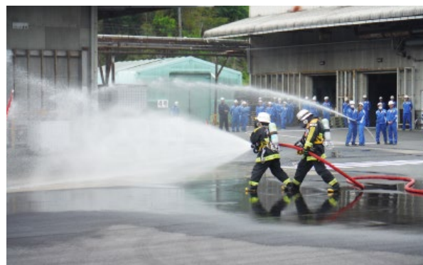
公設消防隊との合同訓練 (滋賀事業所)