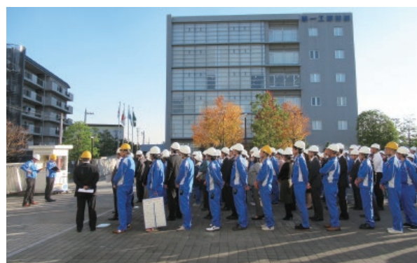
消防署との合同訓練 (京都事業所)