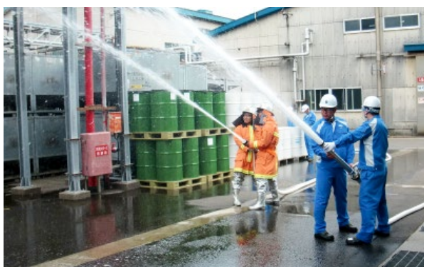
公設消防隊との合同訓練 (大湊事業所)