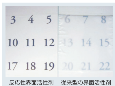
図2 耐水試験の外観