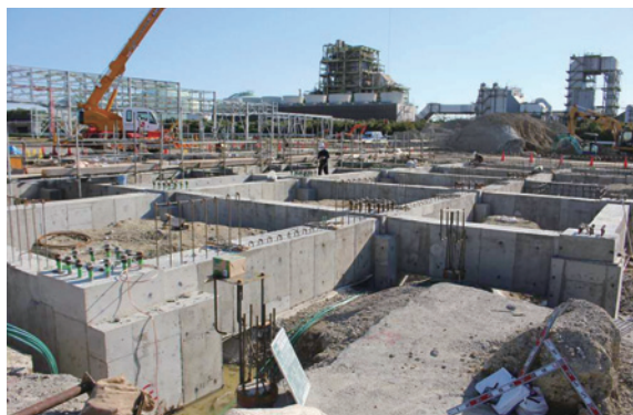
プラント建設中の写真(平成26年10月下旬)

平成26年8月12日に工事の安全を祈願して起工式を執り行い、現在、第一段階として、電子基板用絶縁材料やトンネル工事に用固結剤のプラントの基礎工事を行っています。完工予定は平成27年夏頃です。