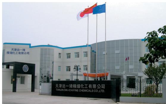
写真1 天津達一琦精細化工有限公司の本社・工場

ウール・カシミア原毛洗淨剤としてモノゲン ® を中国に紹介したのを皮切りに、柔軟剤(タフロン、ファインソフト、ギンソフト、ソフトシリコン)、アルカリ浸透剤(シルケロール)などを製造・販売しています。