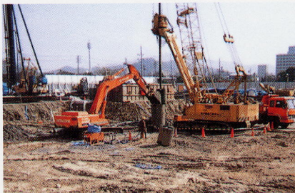
写真1 場所打ち杭 掘削現場

その安定液を掘削に適した液に調整するのが、安定液用ポリマー DKハイポリマー300 、安定液分散剤 マーゼルSH 、安定液変質防止剤 サイファーC です。また、地層により安定液が流出する場合には逸泥防止剤 マッドストップ などが、安全な作業のために役立っています。