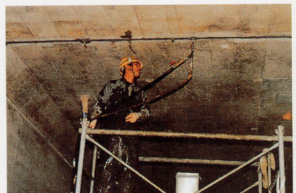
写真3 ポリグラウト漏水止水工事例

ウレタン系止水材 ポリグラウト は構造物内部へ圧入することで、見えないひび割れの漏水と瞬時に反応し漏水を止め、構造物を守ります。