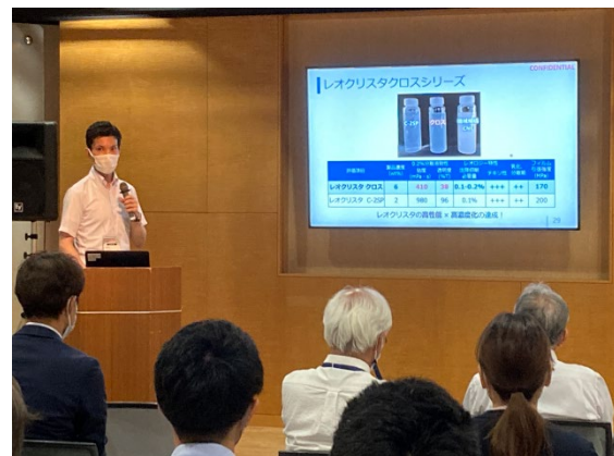
【出展者プレゼンテーションの様子】