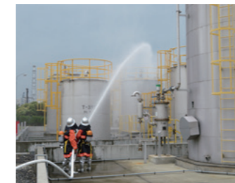
公設消防隊との合同訓練(四日市工場)

2019年度の保安防災対策への投資額は、286.4百万円でした。主に「爆発・火災・漏洩対策」「設備老朽化対策」「労働安全・作業環境改善対策」に投資しました。