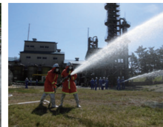
公設消防隊との合同訓練(大湯工場)