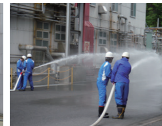
公設消防隊との合同訓練(滋賀工場)