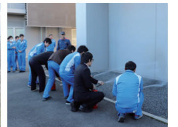
消防署との合同訓練(京都事業所)