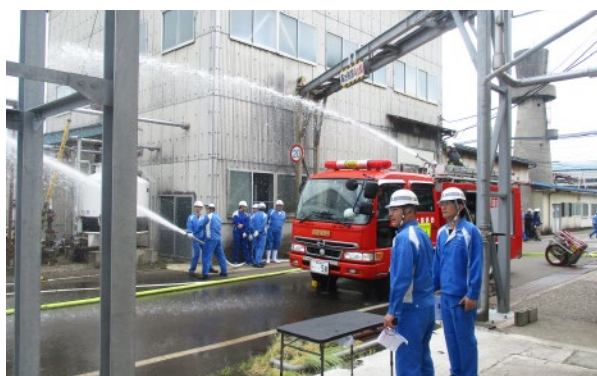
公設消防隊との合同訓練 (大瀧事業所)