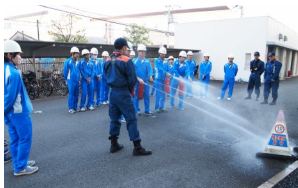
消防署との合同訓練 (京都事業所)