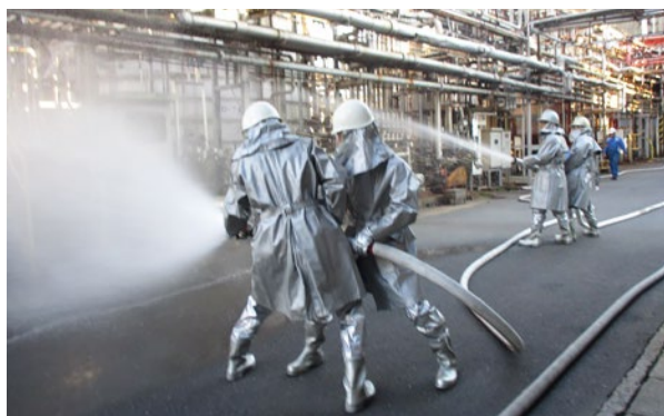
公設消防隊との合同訓練 (四日市事業所)

す。防災訓練においては、地域の消防署のご協力を得て合同で訓練を行うなど、地域と連携した訓練も行っています。化学メーカー固有の事故、災害の未然防止のため、今後も保安防災活動に取り組んでいきます。