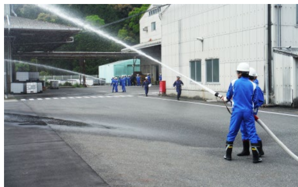
公設消防隊との合同訓練 (滋賀事業所)