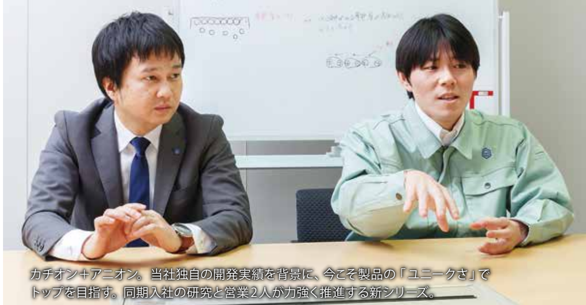
カチオン+アニオン。当社独自の開発実績を背景に、今こそ製品の「ユニークさ」で トップを目指す。同期入社の研究と営業2人が力強く推進する新シリーズ。

大型化や薄型化、さらに高い性能が求められる電子機器市場。 少量添加で帯電防止性能を高める添加剤。