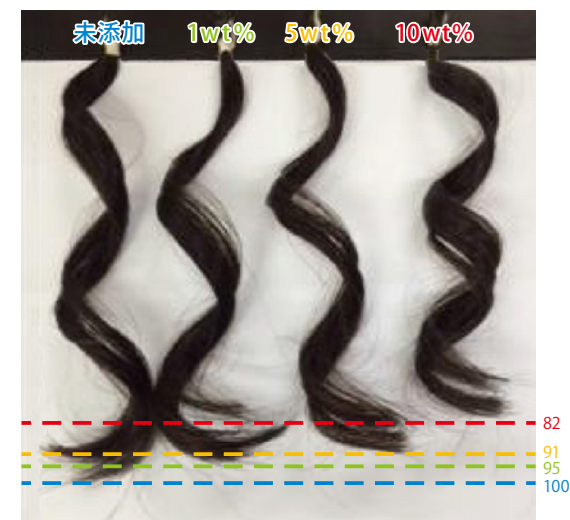
図3 髪のカール保持力 (未添加時と比較した相対値)

ることで高湿度状態でもカールの長さが保持される傾向にある。また、シャンプーで洗い流した際には未添加と同等の洗い上がり性であることを確認している。長時間、高湿度でカール保持力を発揮するヘアスプレー用途への応用が期待できる。