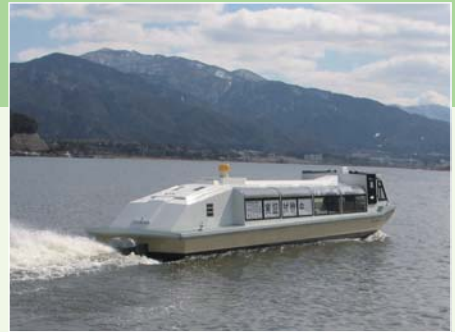
電池駆動船のテスト航行

な特長があります。イオン液体系では安全性に優れた特性を持つリチウムイオン二次電池を設計することができます。