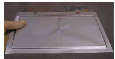
釘刺し試験(破裂・発火なし)